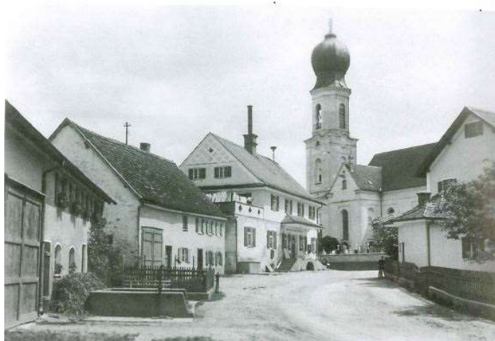
Die Ortsmitte von Moorenweis etwa um das Jahr 1950.

Auch heute ist es so, das Landratsamt Fürstenfeldbruck ist für Moorenweis zuständig.